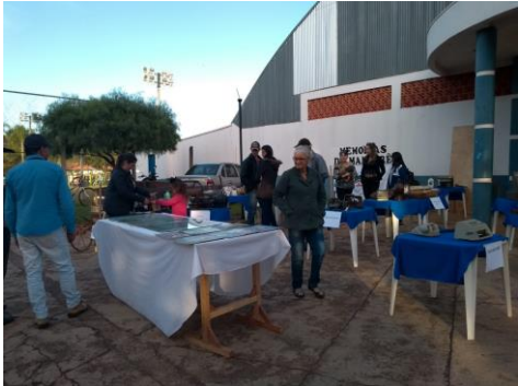
Organização para a Expomam, pais e alunos