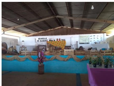
Visitantes na Expomam