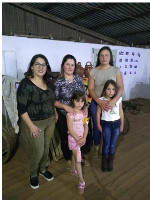
Alunos explicando sobre o Projeto na Expomam