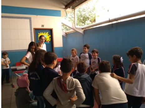
Visitantes da exposição de Objetos antigos na Escola Municipal Elizabete