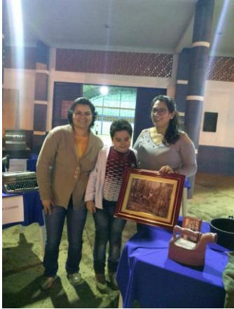
Visitantes na Feira do Produtor