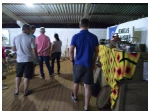
Pais e alunos participando da exposição